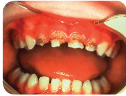
Caries en la infancia

Esto sucede al compartir vasos, tenedores y cucharas, o cuando un adulto limpia un chupón con su propia boca. Estos gérmenes usan